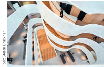
Unternehmenszentrale Schüco One, Bielefeld (3XN architects A/S, DK)

Um die Kommunikation und Kooperation von Richterinnen und Richtern mit Sachverständigen im Zivilprozess drehte sich am 8. März in Düsseldorf die Diskussion auf dem diesjährigen „Gutachtertag“. Eingeladen hatten der Präsident des Oberlandesgerichts sowie die Präsidenten der Industrie- und Handelskammern, der Handwerkskammer Düsseldorf sowie der Architektenkammer NRW und der IK-Bau NRW. Im Mittelpunkt stand die Bedeutung der Kommunikation zwischen Gericht und Sachverständigen sowie die aktuelle Rechtsprechung des Bundesgerichtshofs. □ Di