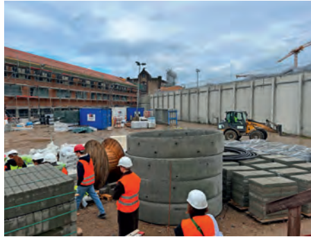
Hinten der historische Altbau, links der Bauabschnitt 1 der neuen JVA Willich