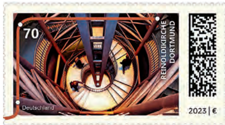
Sonderbriefmarke zur Reinoldikirche Dortmund: Gestaltung Jennifer Dengler, Bonn

Die Stadtbahnstation Reinoldikirche in Dortmund erscheint am 6. April auf einer Sonderbriefmarke der Deutschen Post. Die 70-Cent-Marke zeigt als Motiv diese moderne Wahrzeichen der Westfalenmetropole, an dem sich zwei Stammstrecken des Stadtbahnnetzes der Dortmunder Stadtwerke DSW21 kreuzen. Die Station verweist mit ihrer Dachkonstruktion aus Stahl und Glas und dem hohen Stahlpylon auf die Tradition der Dortmunder Ingenieur- und Stahlbaugeschichte. Entworfen wurde die 1992 eröffnete Stadtbahnstation mit der markanten