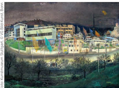
Reinhold Nägele: Weißenhofsiedlung bei Nacht, 1929

1920er! Im Kaleidoskop der Moderne Bundeskunsthalle, Helmut-Kohl-Allee 4 (bis 30. Juli 2023)