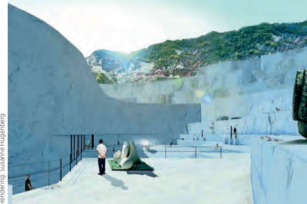
Rendering: Susanne Hugenberg

„Ich arbeite besonders gerne am Entwurf, von der Ideenfindung bis hin zur Gestaltung und Ausarbeitung. Die Beschäftigung mit dem