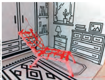
Stuhl aus dem 3D-Stift: Ergebnis des Workshops zu „Sitz richtig!“

Im Anschluss veranstaltete Ursula Thielemann, zweite Vorsitzende im Vorstand „Deutscher Werkbund NW“, einen „Stuhlworkshop unter