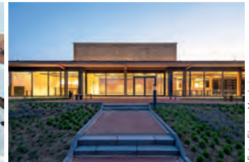
Neubau Kreisarchiv, Viersen (DGM Architekten, Krefeld)