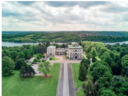
Über dem Baldeneysee: Villa Hügel in Essen

Die Baugeschichte der Krupp-Villa selbst ist nicht unkompliziert. Leitend war der Wunsch Alfred Krupps nach einem großzügigen Landhaus mit hohem häuslichen „Comfort“ einerseits, einem Logierhaus für Gäste andererseits, wodurch der Doppelhauscharakter der Anlage resultierte. Ferner sollten die Gebäude technisch auf neuestem Stand sein, wozu eine aufwändige Haustechnik mit Lüftungs- und Heizungsanlage installiert wurde, die das aus der Ruhr hochgepumpte Wasser in Kesseln im Keller erwärmte. Hingegen blieb die Lüftungsanlage eine Dauerbaustelle, die erst Jahre später zufriedenstellend arbeitete.